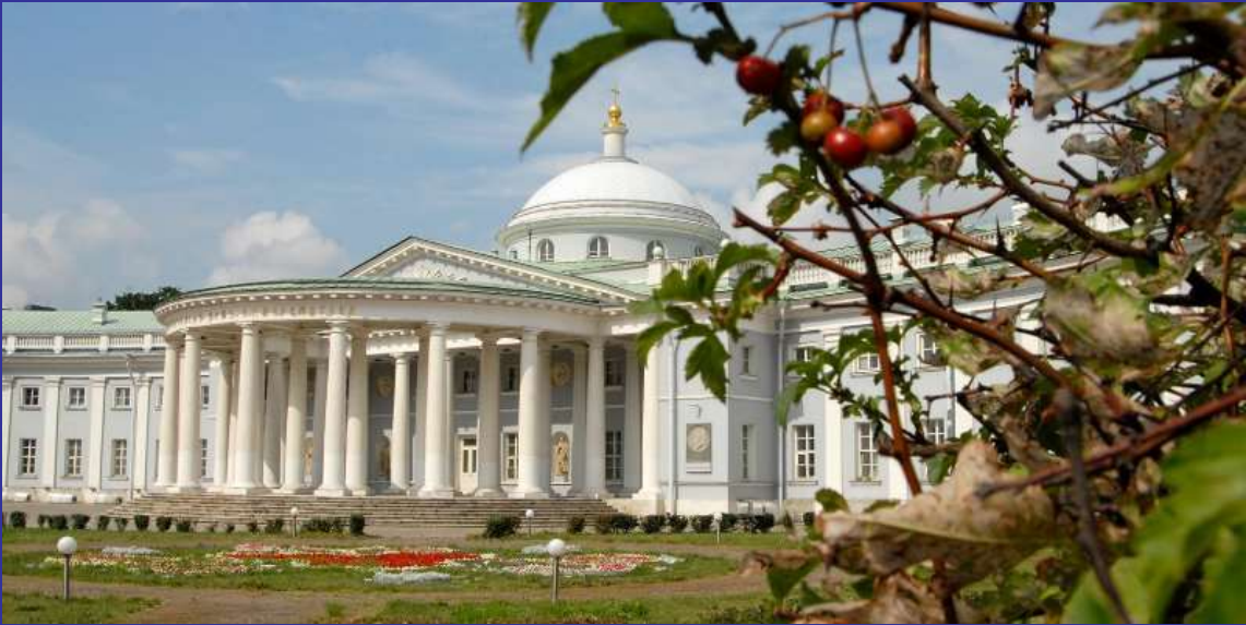
l'Institut SKLIFFOSOVSKY de la médecine d'urgence (Moscou)

Il donne, également, sa classification des méthodes de la prise en charge de l'ankylose de l'ATM.