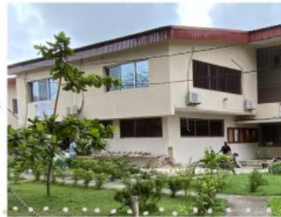
Façade principale de l'Ecole dentaire après la rénovation