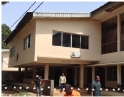
Façade principale de l'Ecole dentaire avant la rénovation